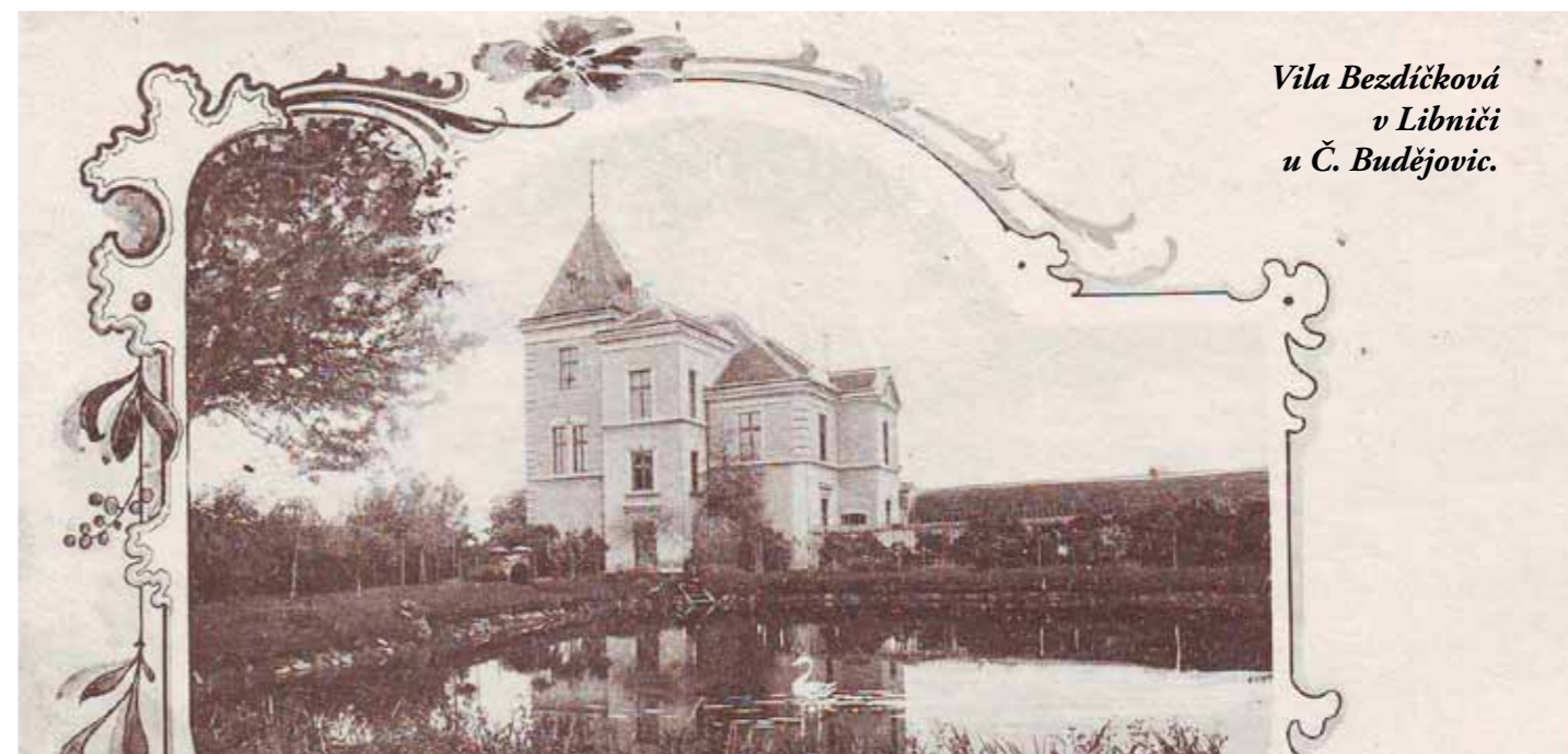
Vila Bezdíčková v Libniči u Č. Budějovic.