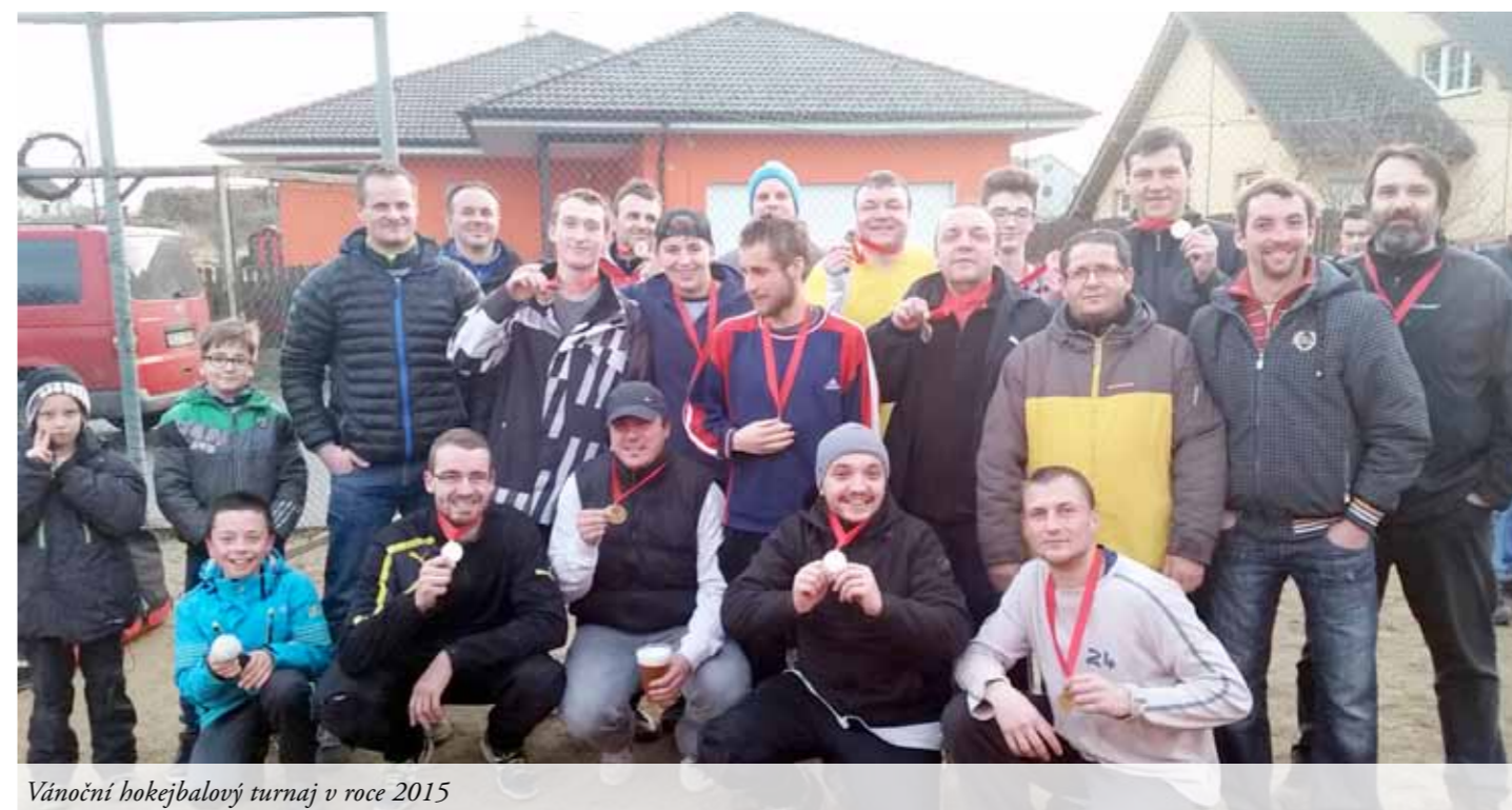
Vánoční hokejbalový turnaj v roce 2015