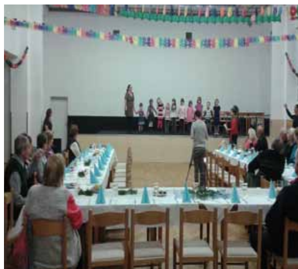
7. prosince 2014 Setkání seniorů se zdobením vánočního stromečku