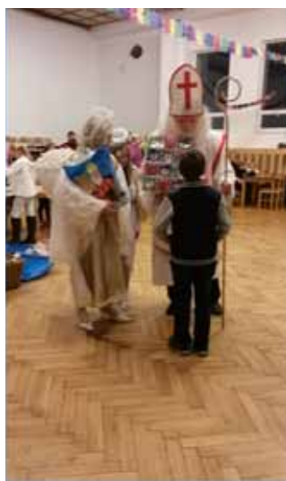
7. prosince 2014 Mikuláš