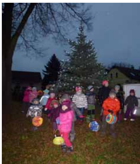
30. Listopadu 2014 - lampiónový průvod